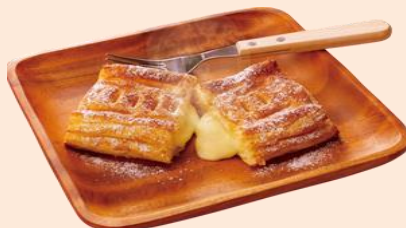
焼きたてカスタードパイ