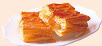
焼きたてアップルパイ