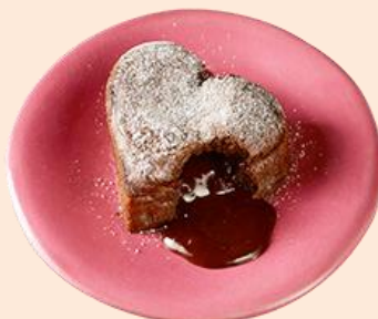
恋するフォンダンショコラ