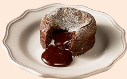
焼きたてフォンダンショコラ

ドミノ・ピザでは「焼きたてプチパンケーキ」だけではなく、焼きたてを楽しめる本格スイーツを続々と発売中！今年 2 月に発売した「焼きたてフォンダンショコラ」は、発売以降原材料が無くなるほど大人気商品となり、定番メニューの「焼きたてアップルパイ」や「焼きたてカスタードパイ」、「エッグタルト」と並ぶ、ドミノ・ピザを代表するデザートメニューとなりました。「焼きたてプチパンケーキ」とあわせて、他の焼きたてスイーツも是非お楽しみください。